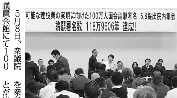
署名を受け取る福島瑞穂 参議院議員(中央右)