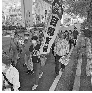
有明防災公園から豊洲まで行進する目黒支部の仲間

に変わらなければならない。私達の子孫のためにこの憲法を作り二度と戦争をさせない憲法だと謳っている。戦争につながる憲法改悪に反対する。今日集まった皆さんと憲法を生かす政治を取りもどそう」と呼びかけました。