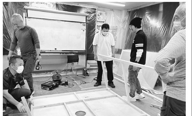
短期間で次々と作り上げる実行委員の仲間