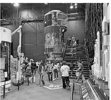
近未来的な宇宙館の様子

開発に対する情熱は、宇宙探査の重要性や可能性を強く感じさせてくれました。施設内では実際にロケットの模擬打ち