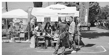
組織部長も激励に訪れ受付人数も200人を越えました

した。あらかじめ板に穴が開いていて、そこに釘を打ち込むのですが、金槌を持ったことのない子どもにはかなり難しいようでした。一生懸命釘を打ち込む子どもたちの顔は真剣そのものです。あの可愛らしさ！お手伝いをさせて頂き新しい感動を受けました。完成して、ハイと手渡したときの嬉しそうな顔もまた格別です。同行されたお父さんお母さん方の笑顔も素敵でした。