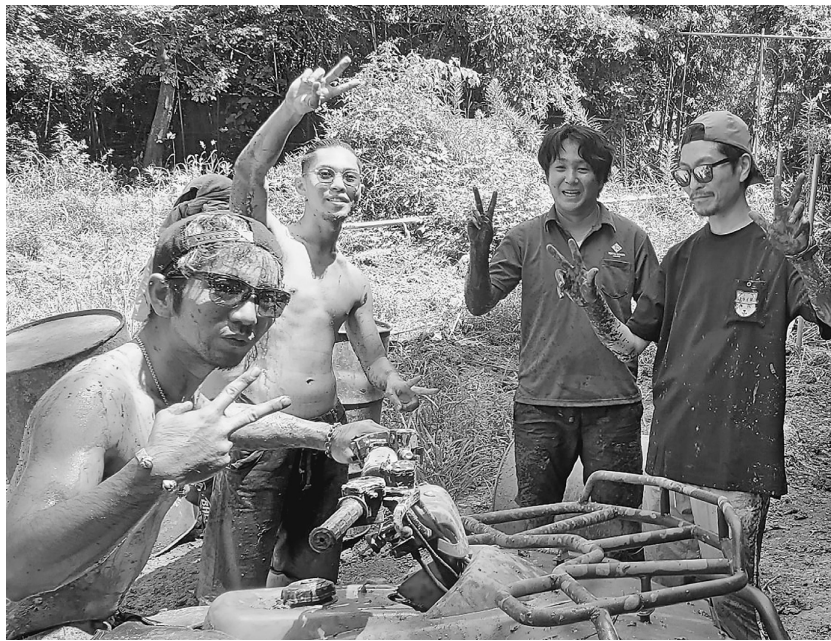
泥だらけのバギーレク

8月4日(日)青年・後継者合同レクで千葉県印西市師戸にある東京バギー村に行きました。参加人数は8人。ここではバギーやピザ作り体験だけでなく、サバイバルゲームもできる場所もあって利用するお客さんもかなりいました。