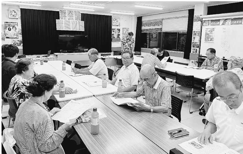
群会議のやり方・悩み等を話し合う

8月27日に組織部主催で初となる、群会議サミットが行われ分会役員、書記23人が参加しました。事前に群にアンケートをお願いし、集約してからの開催となりました。様々な群会議のやり方・開催の仕方・群の状況・群の悩み等のアンケートを取り、群会議サミットで話し合い、解決策や状況等様々な意見が出されました。