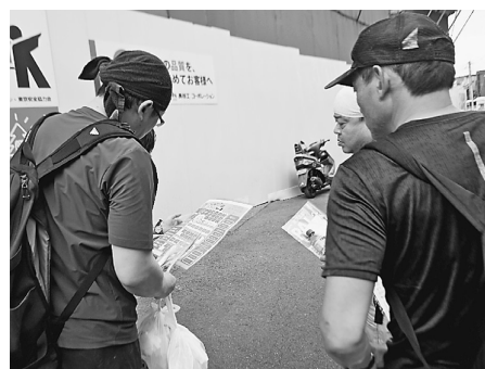
現場からの退勤時に指差しアンケートを取る

で疲れさま現場宣伝を行いました。冷たいお茶と資料・タオルを渡し、「指差しスバットアンケート」で従事者の状況を確認しました。現場の入場人数が少なく、30分ほどで10数人の現場退場者の内、4人がアンケートに答えてくれました。