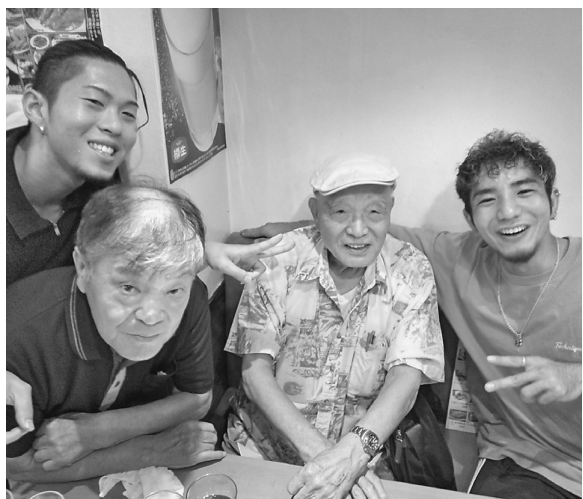
北部さくらの出陣式には青年部も参加した