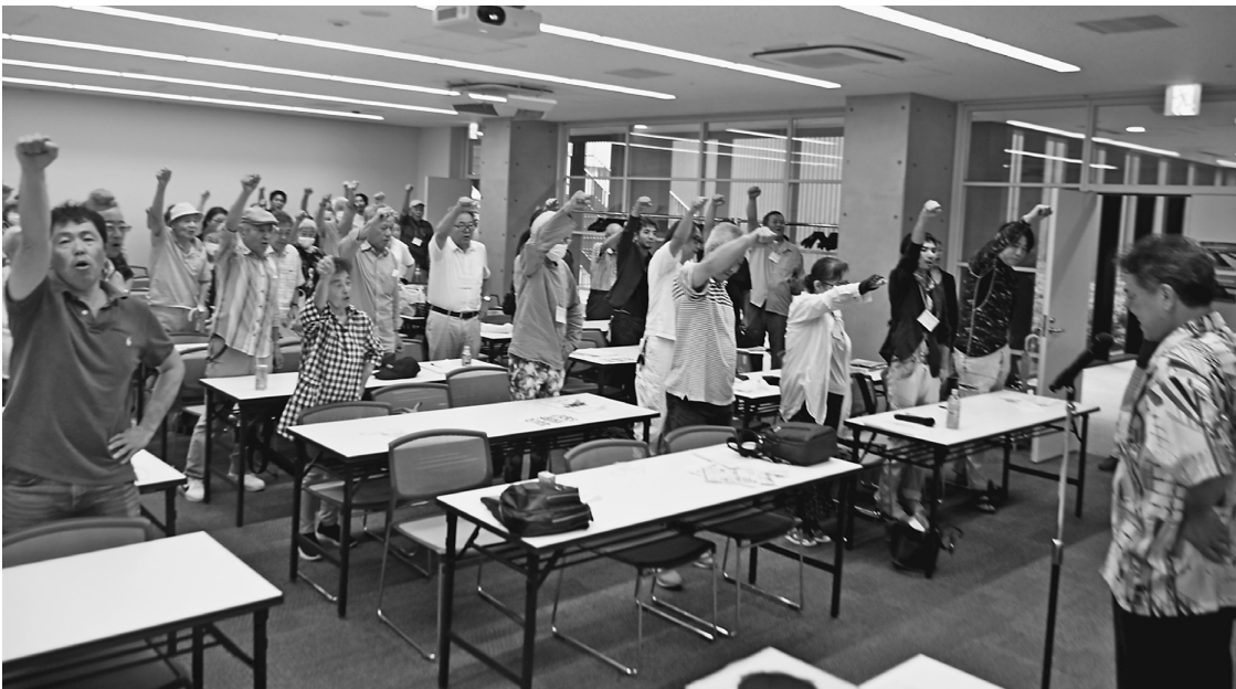
勝間田書記長(右)の団結ガンバロー