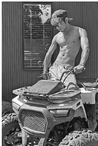
浅野本部青年部長の鋼の肉体

バギーの運転はかなりハードコースで、最初に急な下り坂に行ったり、道を曲がる時もハンドルを回すのに一苦労だったり、泥沼にはまって車体を押し上げたりして泥々になって大変でした。服も汚れて、特に押し出した時の沼がかなり深かったの下半身がかなり濡れました。ただ、同時に楽しかったです。