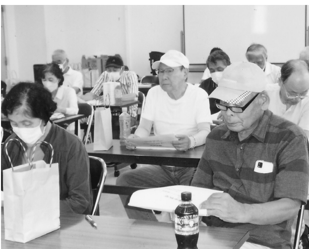
19人が参加した月向健康教室