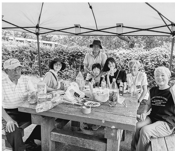
全世代で盛上がる柿の木八雲分会