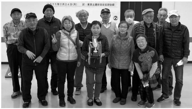
初優勝した目黒選抜チーム

令和7年2月23日 野1チーム、新宿1チーム、渋谷2チーム、世田谷2チーム、目黒2チーム、の6支部から、会館にて西部ブロック輪投げ大会に参加しました。