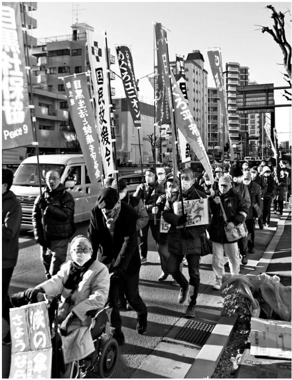
パレードの先頭を行進する目黒支部の仲間

東京土建一般労働組合 西南合同支部 渋谷区幡ヶ谷2-18-6 6304-2315 渋谷区世田谷3413-3020 目黒区黒目3719-2741 発行 伊藤 勝伸 定価 1部 30円 購読料は組合費に 含めて毎月徴収