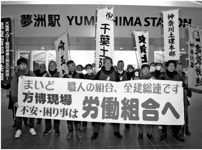
夢洲駅前に集合した関東地協連絡協議会の仲間

4月13日の大阪万博開催日に工事が間に合わないからと、24時間体制で工事が行われていて、との情報を得た全建総連関西地協は、全建総連を通じて全国の仲間らに2025年3月4日に大阪万博工事ゲートにおいての現場宣伝を行うと、応援の要請がありました。 その要請を受け万博会場となる夢洲(ゆめしま)に向かう、関東地協連絡協議会(埼玉土建・千葉土建・神奈川土建・神奈川県連)の仲間と大阪メトロを乗り継ぎ目的の地の新しく造られた夢洲駅に到着。夢洲駅構内の大きさに目を奪われてしまつ、改札ゲートの多さに万博開催中は必要だが市内から離れた埋め立ての島には必要ないと思ひ、関西地協の仲間らに尋ねると、万博が終わった後に「IR」の開 発、カシノや大型ショッピングモールで人が大勢来ることを見越した大型の駅だという、駅の階段を上り地上に出ると、前方300メートル程先に、報道がよく流れていたCLT(直交集成板)で作られた木造混構造物が目に飛び込んできました。ここが万博会場であり、24時間体制で建設労働者を働かせている現場かと思ひ、気合がより一層入りました。集まった仲間らで早速準備、持つて行った東京土建本部ののぼり旗を竿に取り付けると、大阪湾の埋め立ての島で風が強く指を付けていないと旗が上に寄ってしまつてしまいました。宣伝を始めた後、午後4時半ころから入っていくとのことでした。 今回の関西地協の現場宣伝で、働き方改革や担い手3法の改正と入り、受け取る人、見