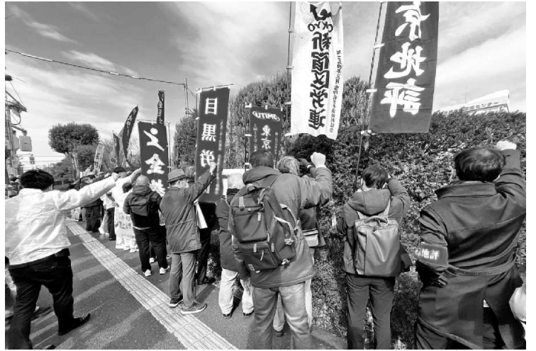
東京医療センターへ声を上げる宣伝参加者

2月28日東京医療センターの早朝ストライキに参加しました。最近ストライキと言っ言葉の時々耳にします。私のような60代は、ストライキは権利だと学校で習いました。40代50代は、ストライキは迷惑と習っています。そのせいか1980年以降ストライキは、本当に少なくなりました。でもこの3年で耳にするようになりまし、そしてそれはそれなりの成果を挙げています。ストライキをやる人達の覚悟を感じます。先日、医療センターの待ち合いでこんな会話を耳にしました「国から金貰う国立病院が何でストライキなんかやっているんだ」と怒っている人、それは間違っています。今は国立病院機構は国から一銭も貰っていません。むしろ私立の大学