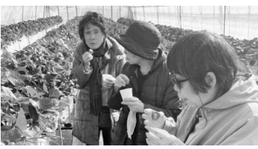
贅沢なイチゴ狩りの様子

2月9日(日)月向バスで始めた企画した新年会イチゴ狩りはハトバスによる栃木の旅行がスタートしました。参加者31人(大人25人・子ども6人)です。