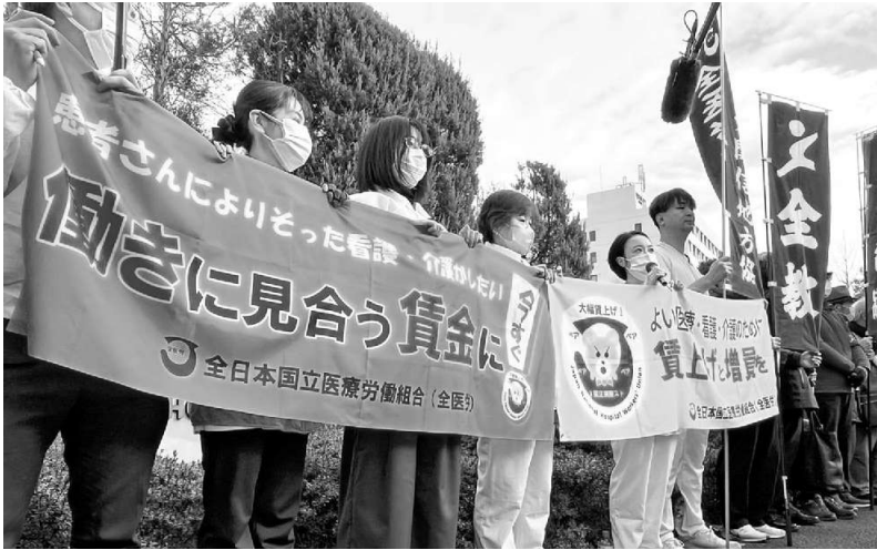
賃上げと人手不足を訴える全医労の組合員

2月28日東京医療センターの早朝ストライキに参加しました。最近ストライキと言っ言葉の時々耳にします。私のような60代は、ストライキは権利だと学校で習いました。40代50代は、ストライキは迷惑と習っています。そのせいか1980年以降ストライキは、本当に少なくなりました。でもこの3年で耳にするようになりまし、そしてそれはそれなりの成果を挙げています。ストライキをやる人達の覚悟を感じます。先日、医療センターの待ち合いでこんな会話を耳にしました「国から金貰う国立病院が何でストライキなんかやっているんだ」と怒っている人、それは間違っています。今は国立病院機構は国から一銭も貰っていません。むしろ私立の大学